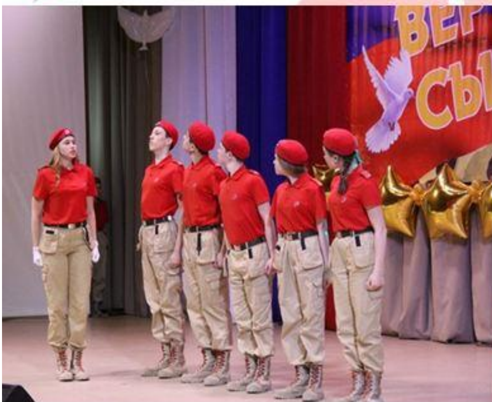
10.05.2018. Закрытие фестиваля «Отчизны верные сыны»*